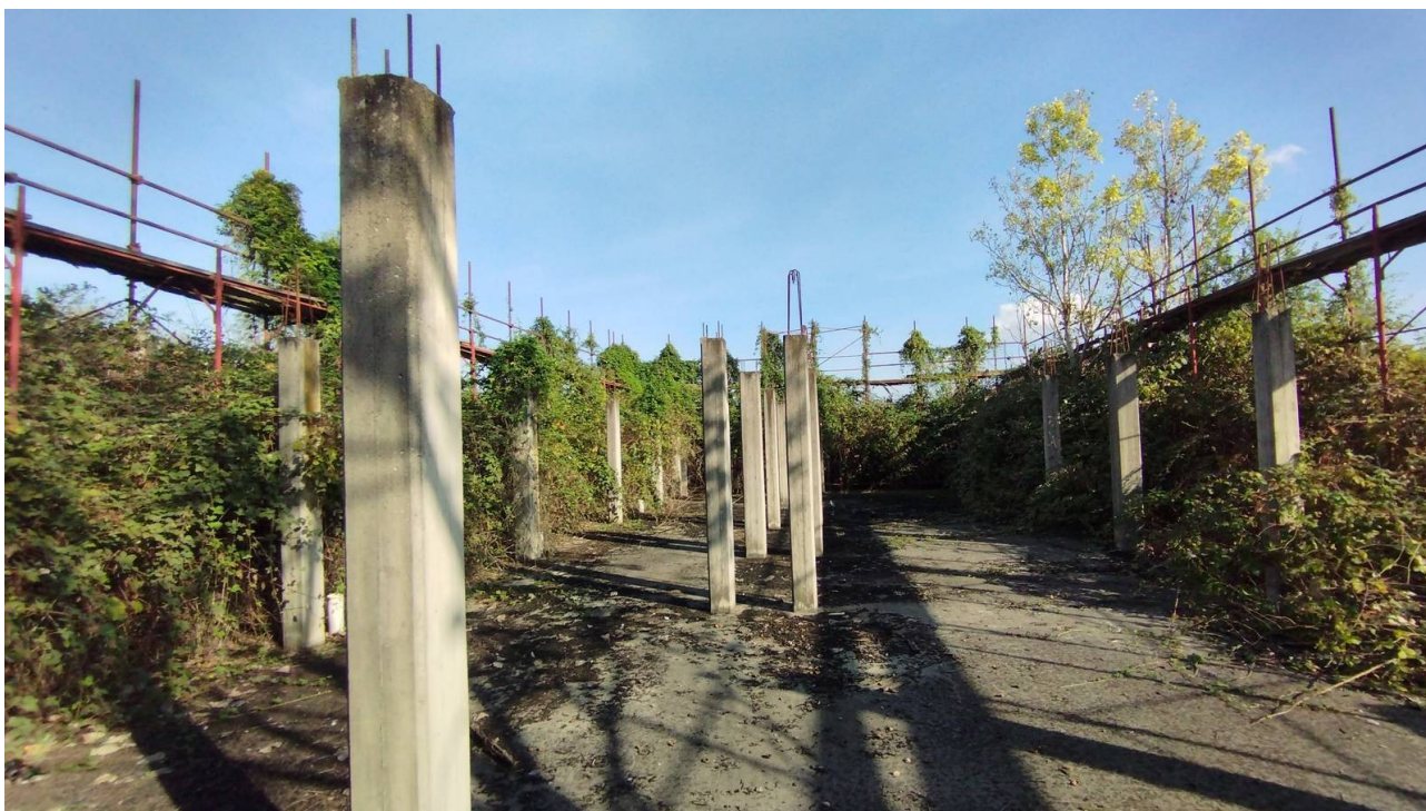
F27 | Piano terreno - fabbricato E