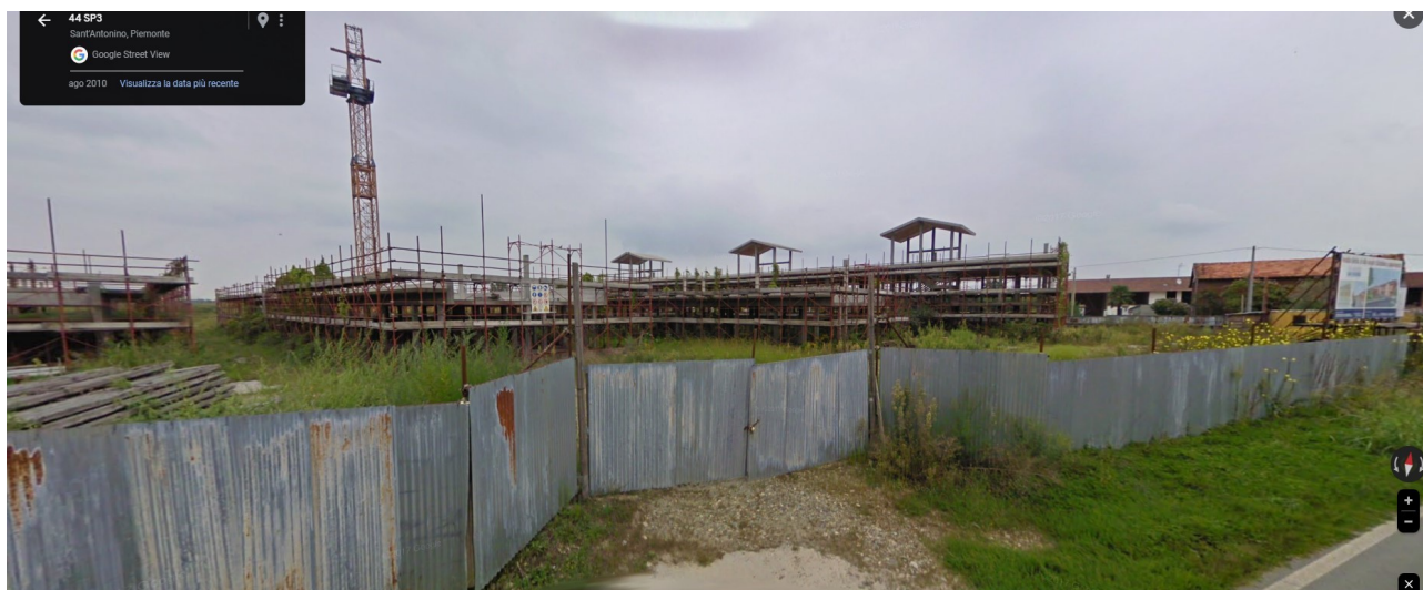
F07_agosto 2010 | Zona di ingresso all'area di cantiere

REALIZZAZIONE IMPIANTI SPORTIVI IN FRAZIONE SANT'ANTONINO – FASE 1 INTERVENTO DI DEMOLIZIONE