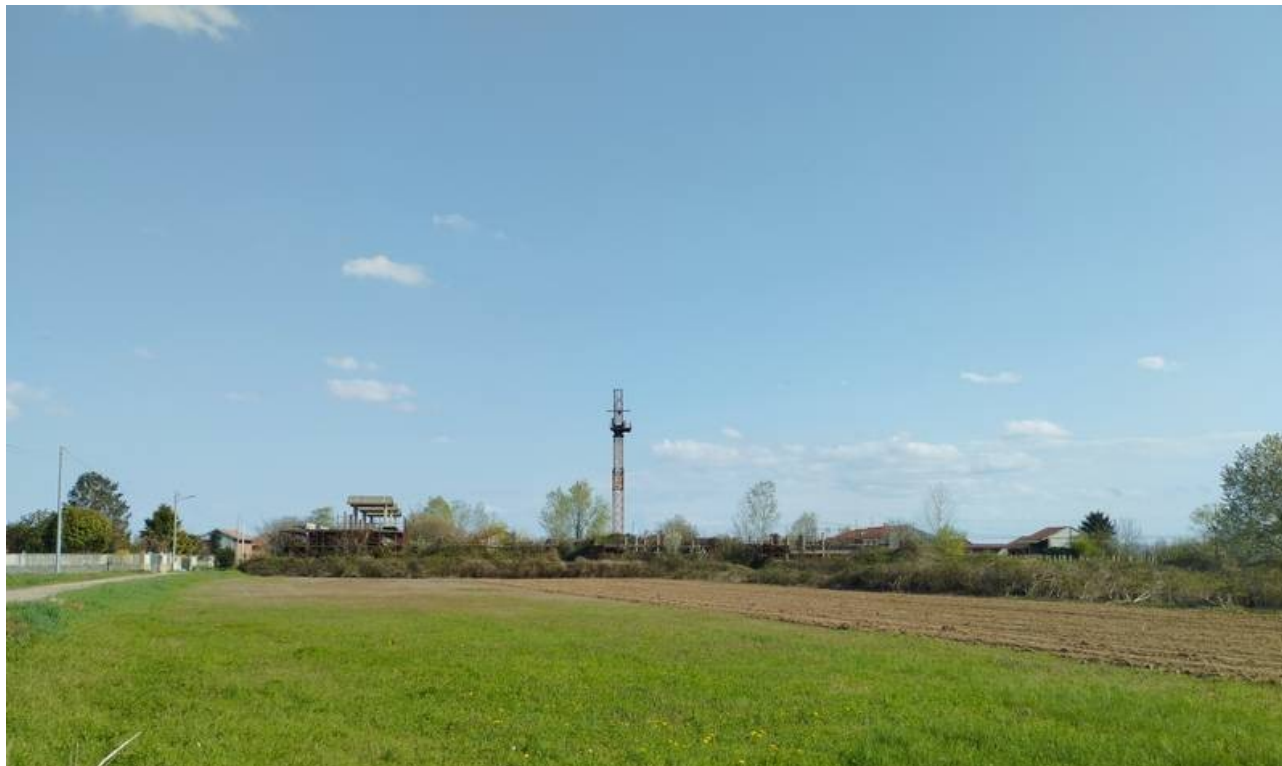
F04 | Fronte Nord-Ovest del lotto oggetto d'intervento