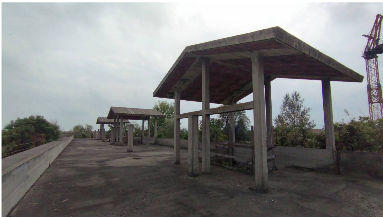
F15 | Piano secondo - fabbricato A