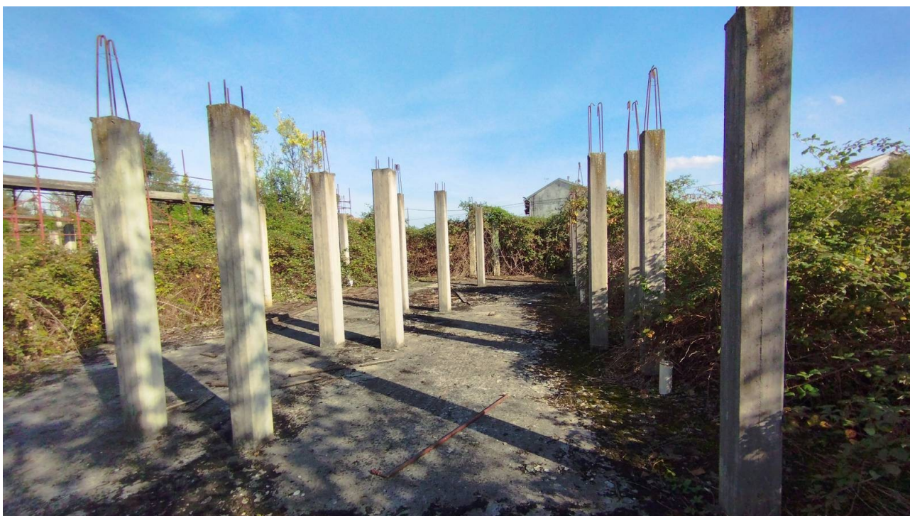
F30 | Piano terreno - fabbricato G