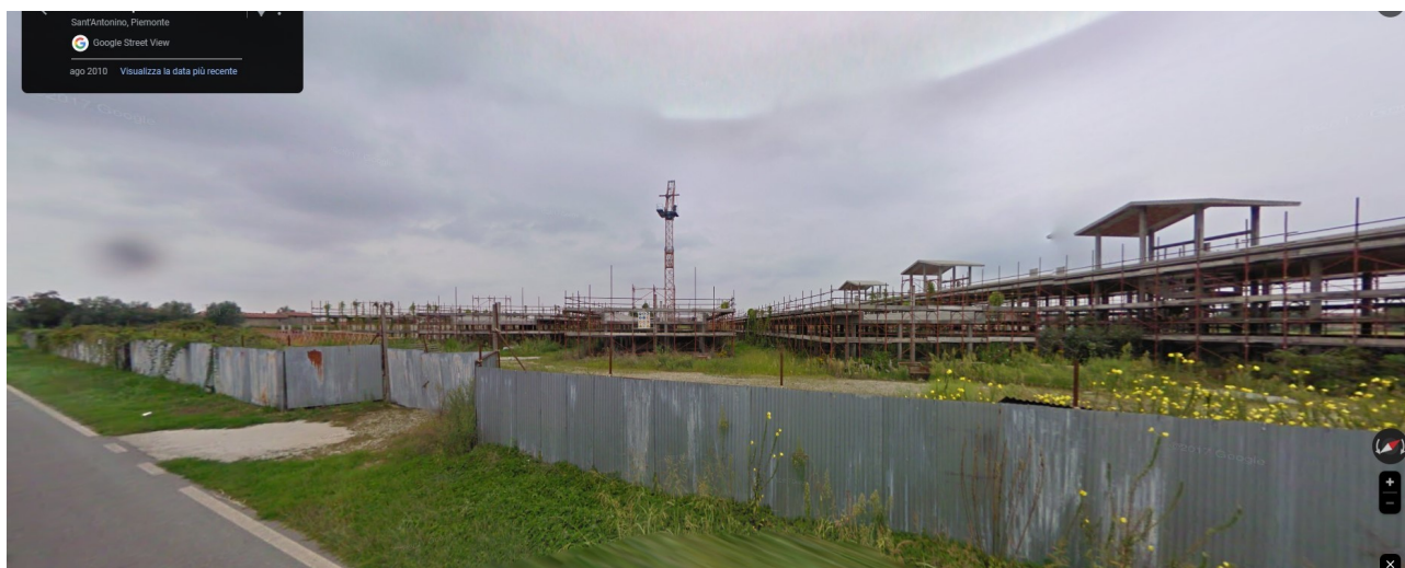
F08_agosto 2010 | il cantiere visto da nord-est