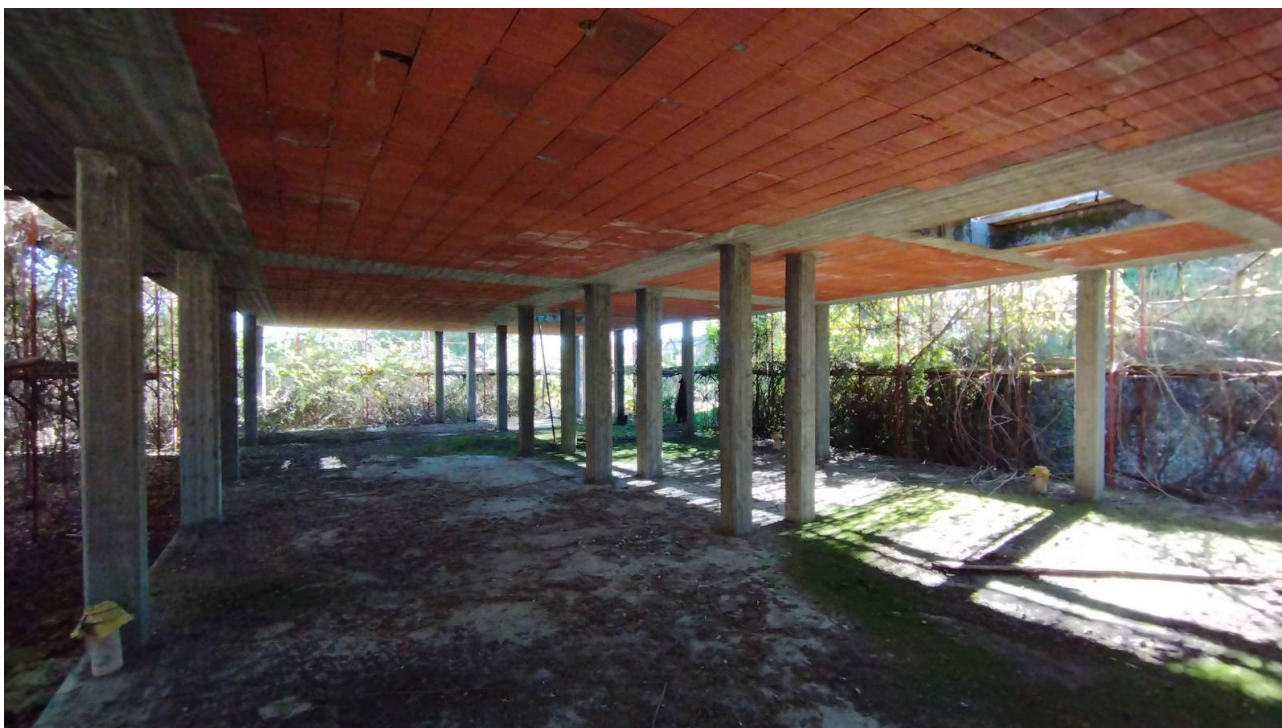
F19 | Piano terreno - fabbricato B