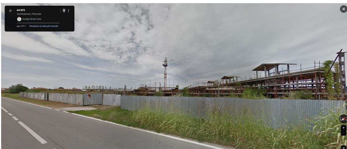
F11_agosto 2011 | Fronte Sud-Est – tutti i fabbricati