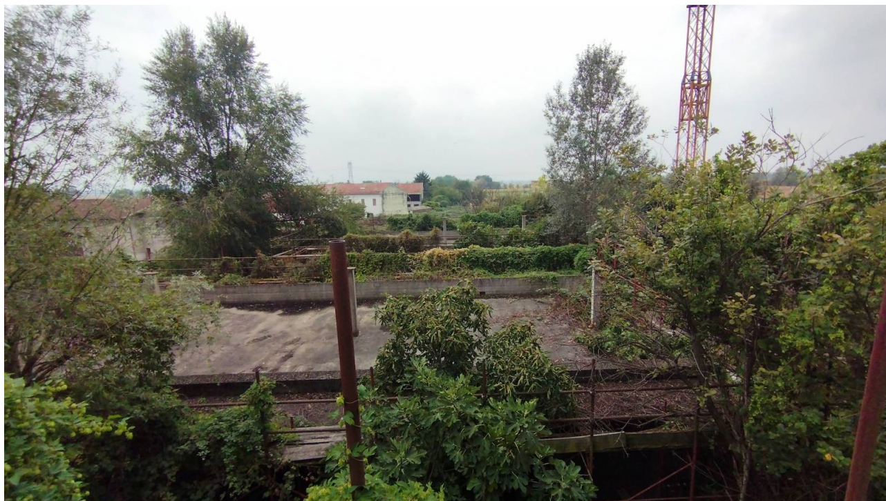
F20 | Piano primo - fabbricato B