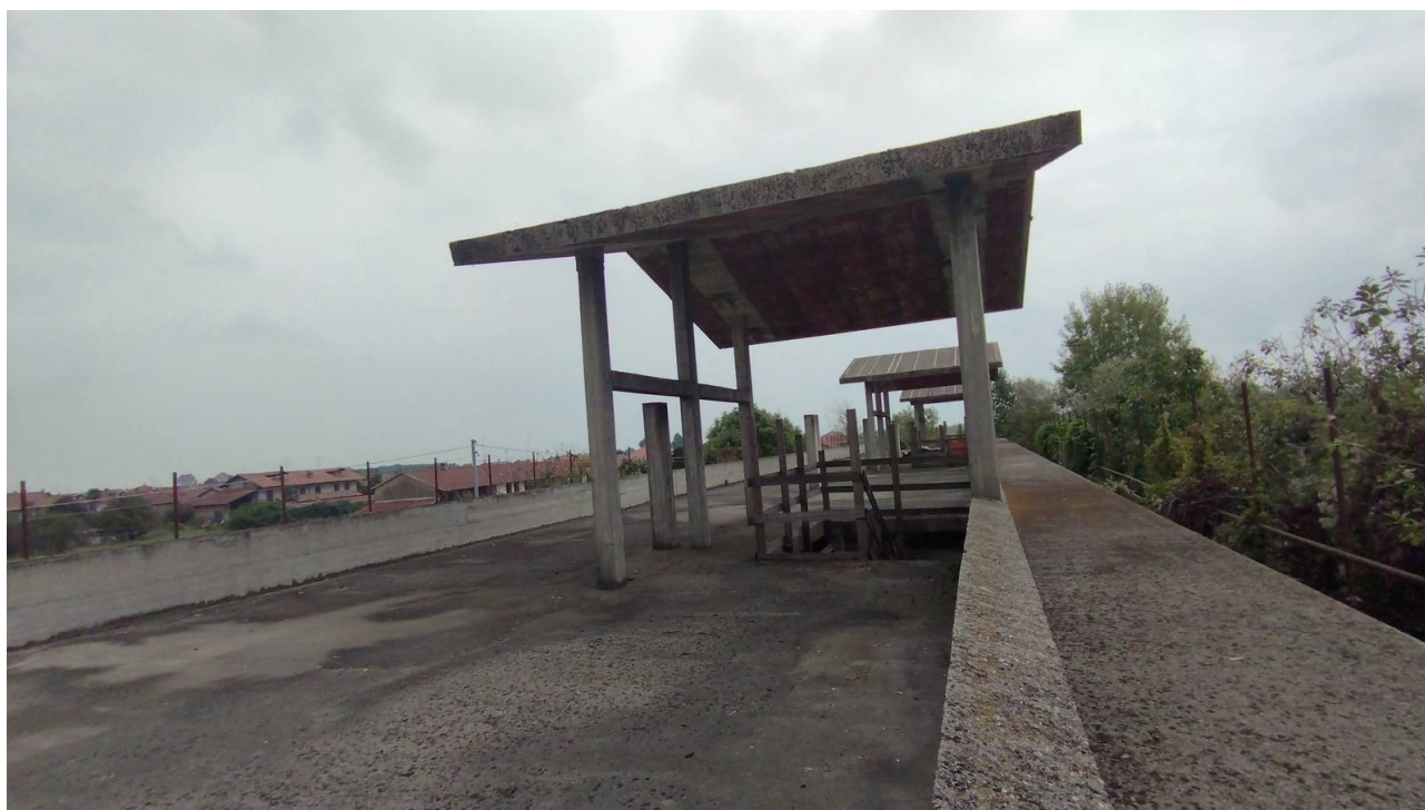
F16 | Piano secondo - fabbricato A