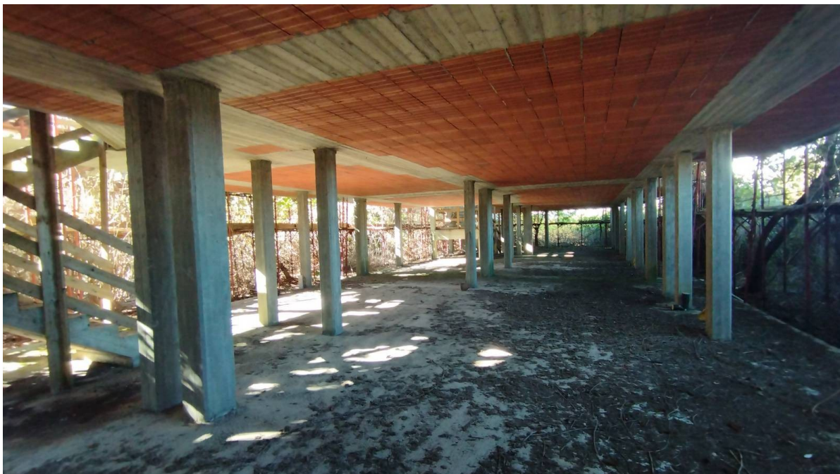
F13 | Piano terreno - fabbricato A