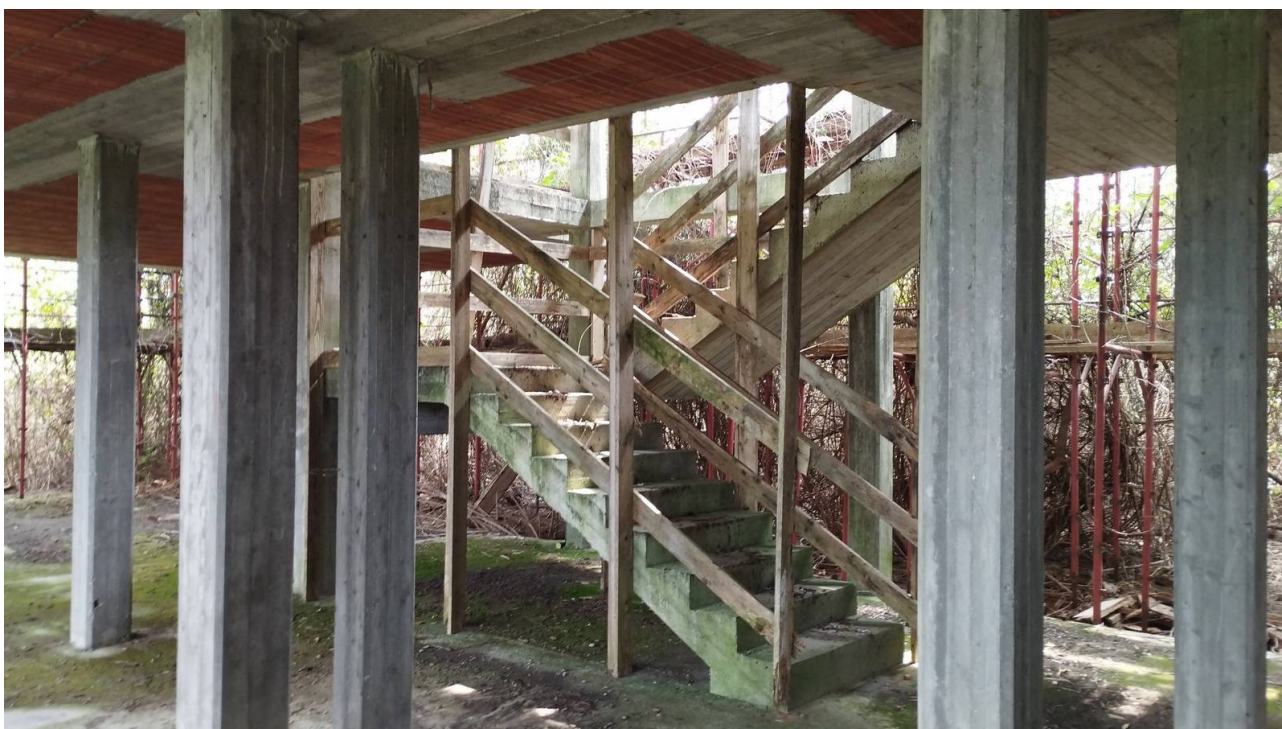
F17 | Particolare scala piano terreno - fabbricato A