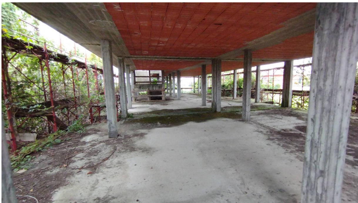
F14 | Piano primo - fabbricato A