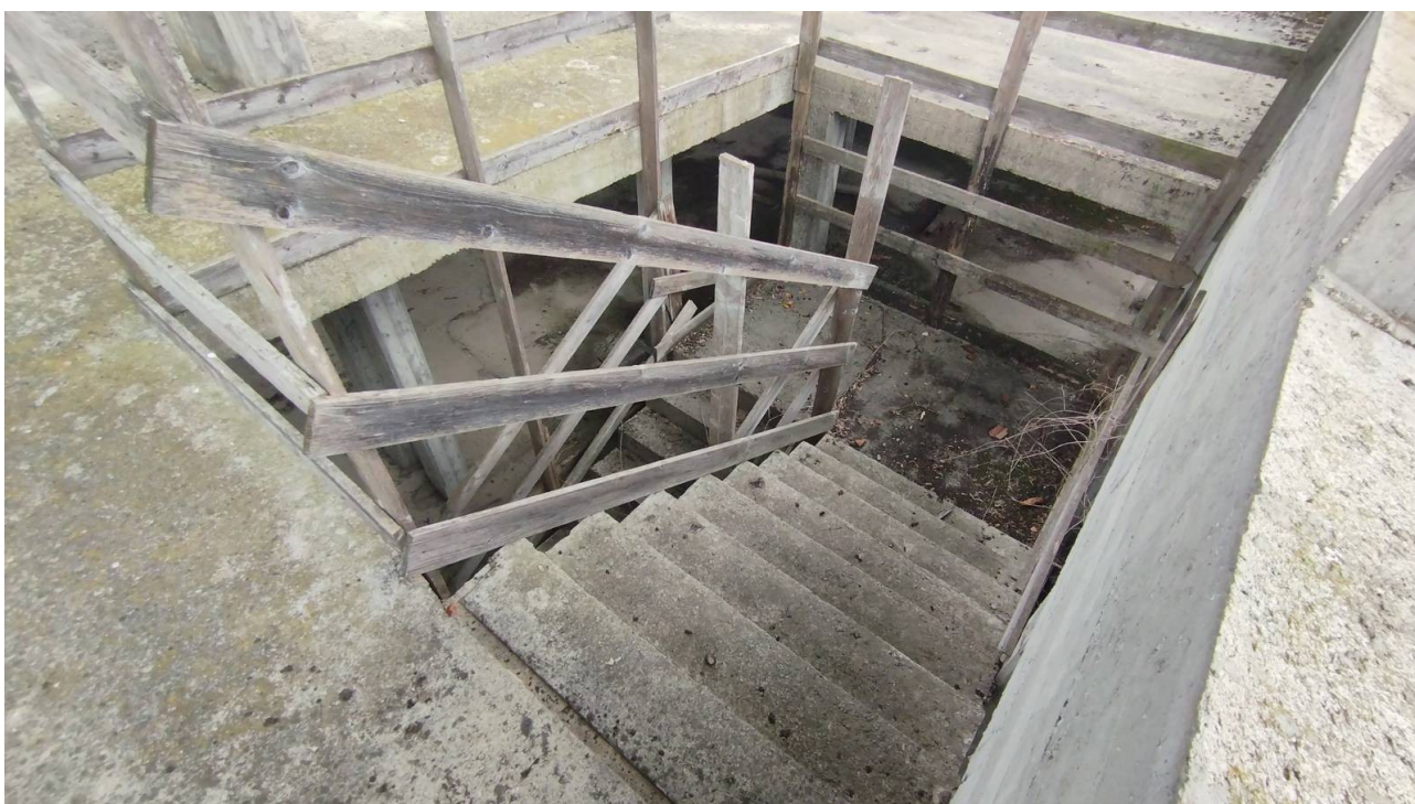
F18 | Particolare scala piano secondo - fabbricato A