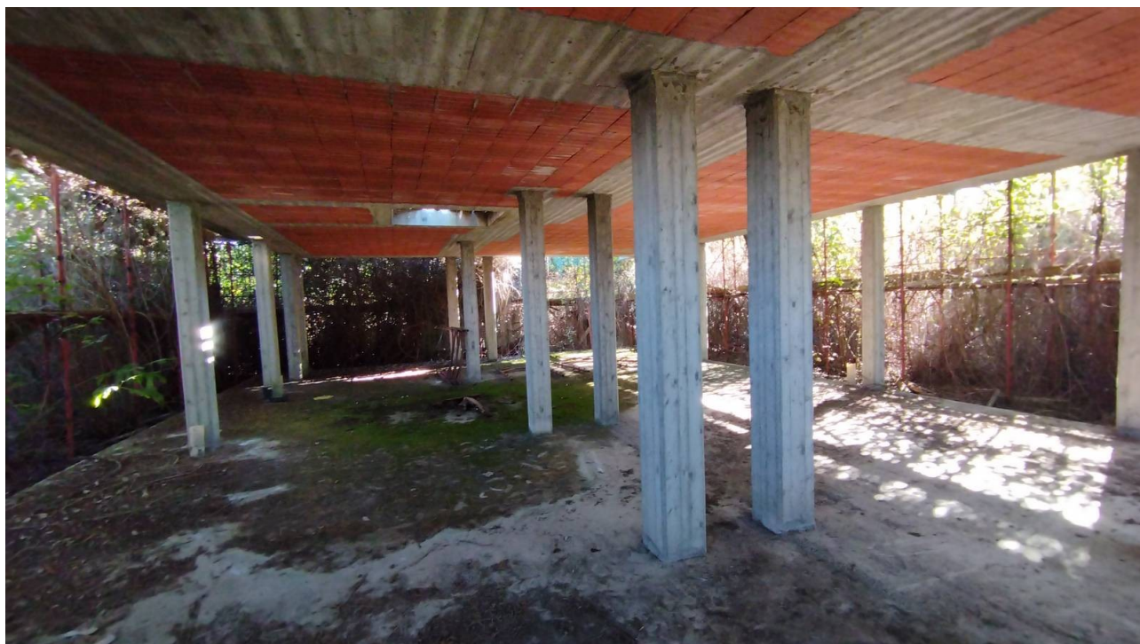
F24 | Piano terreno - fabbricato C1