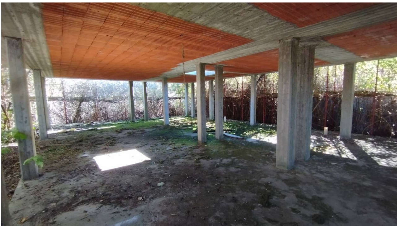
F21 | Piano terreno - fabbricato B1