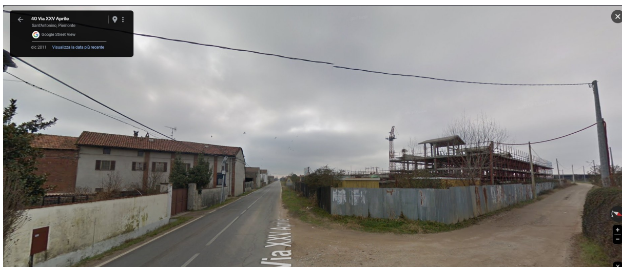
F10_dicembre 2011 | Fronti Nord-Est e Sud-Est - fabbricati 19/30 in primo piano

REALIZZAZIONE IMPIANTI SPORTIVI IN FRAZIONE SANT'ANTONINO – FASE 1 INTERVENTO DI DEMOLIZIONE