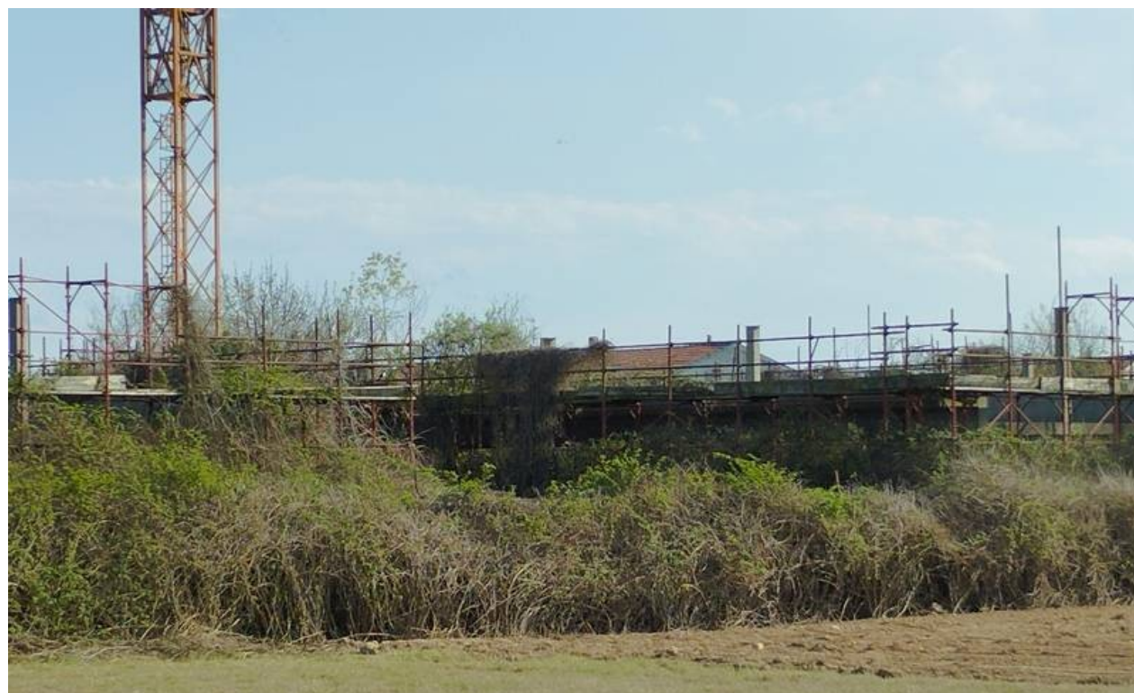
F02 | Fronte Nord-Ovest – strutture B1 - C1