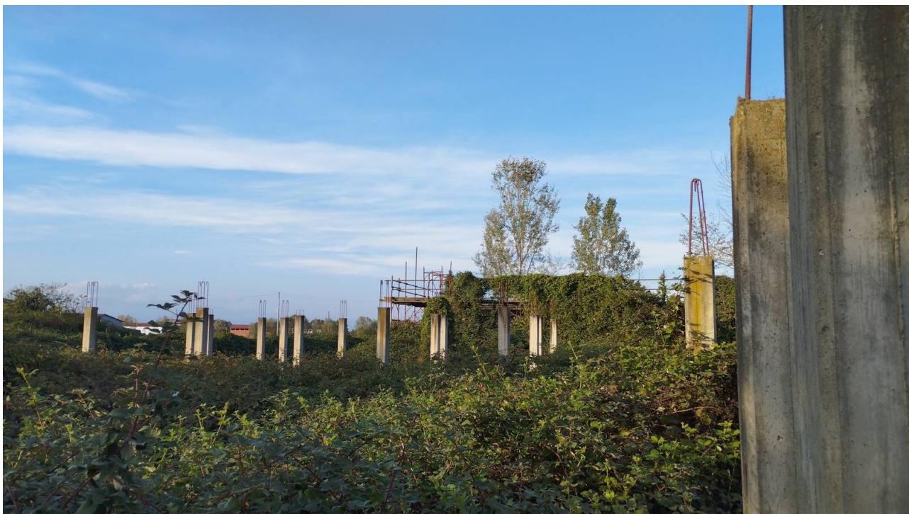
F28 | Piano terreno - fabbricato F-H