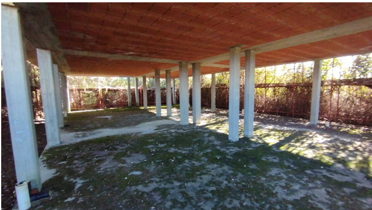
F26 | Piano terreno - fabbricato D1