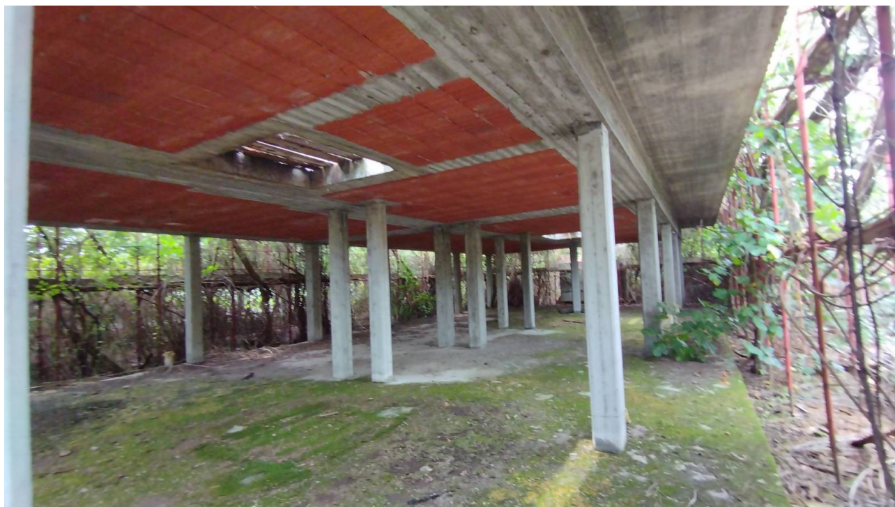
F23 | Piano terreno - fabbricato C