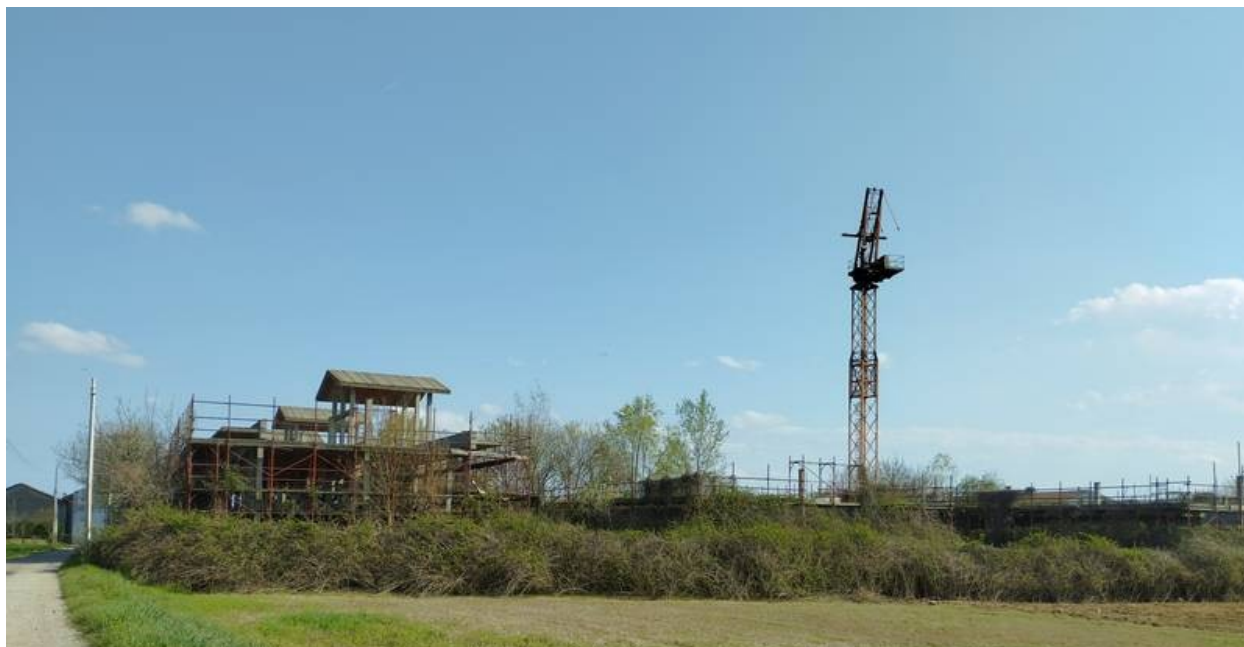
F01 | Fronte Nord-Ovest – strutture A – B1 - C1

Rilievo fotografico effettuato in molteplici sopralluoghi presso la località integrato da alcune foto storiche ricavate da Google Maps utili a descrivere lo stato dei luoghi.