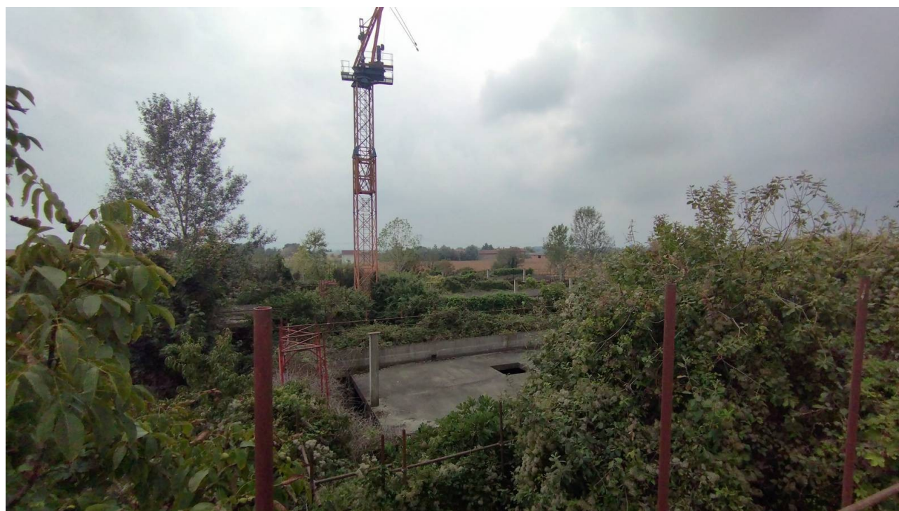
F22 | Piano primo - fabbricato B1