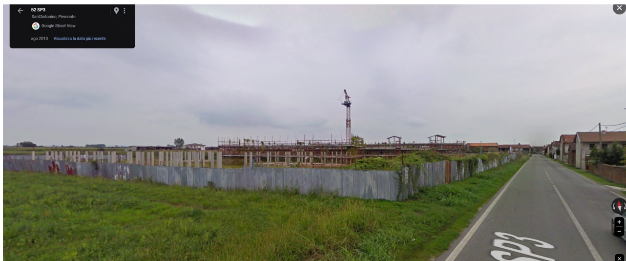
F09_agosto 2010 | l'area di intervento vista da sud-est