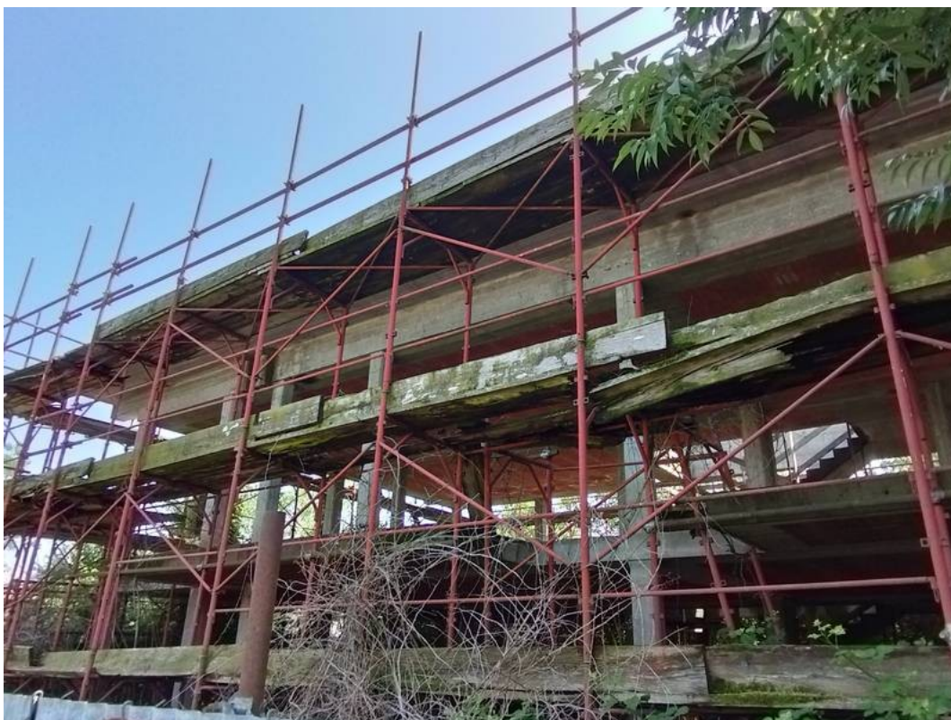
F05 | Fronti nord della struttura A