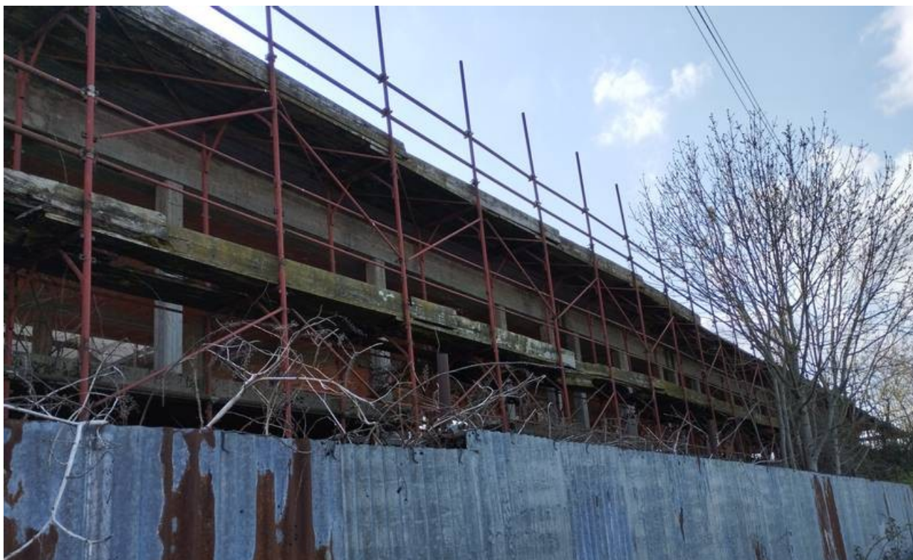
F03 | Fronte Nord-est struttura A