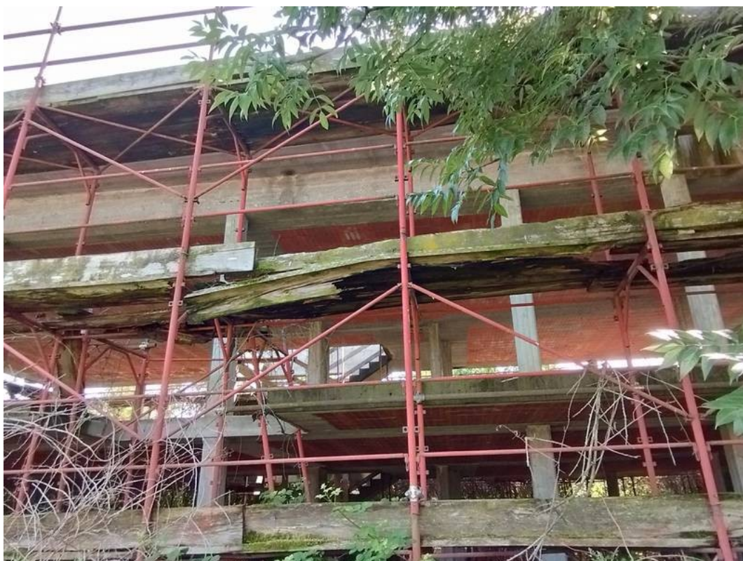
F06 | Fronti nord della struttura A