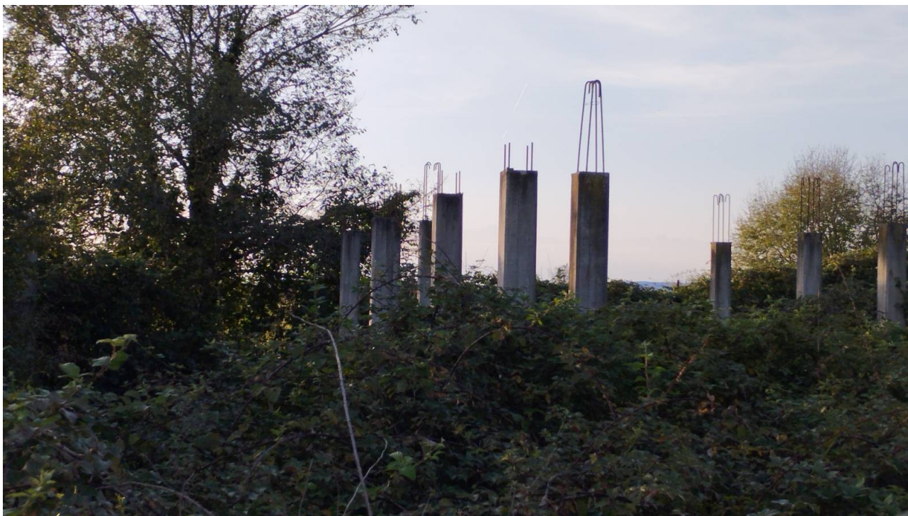
F29 | Piano terreno - fabbricato F-H